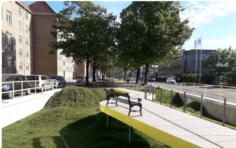
Scandiagade efter ombygningen. 2020

Normal viser vi foto fra det gamle Sydhavnen, men vores gamle bydel ændrer sig i disse år, hvor Mozarts Plads er en stor byggeplads for den kommende Metrostation, og området ved Karens Minde og Sjælør Boulevard er endevendt for at sikre mod fremtidige oversvømmelser.